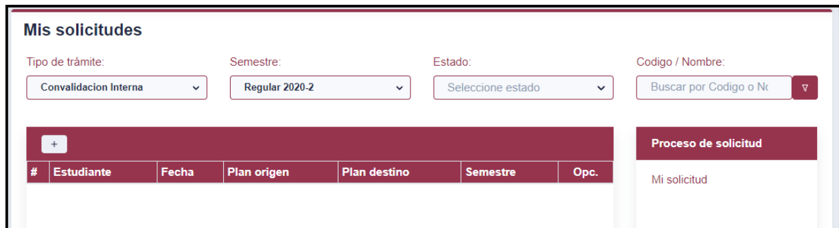
Figura 5 – Mis solicitudes

Elegir la opción de Mis Solicitudes, el sistema mostrará un reporte para seleccionar los siguientes filtros: (1) Tipo de trámite: convalidación interna, (2) semestre. Ver Figura 5.