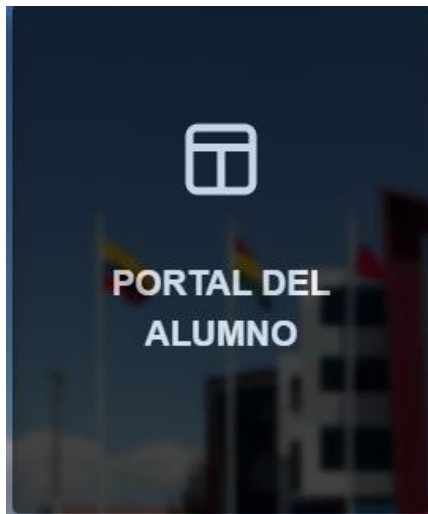
Figura 3 – Módulo Portal del Alumno