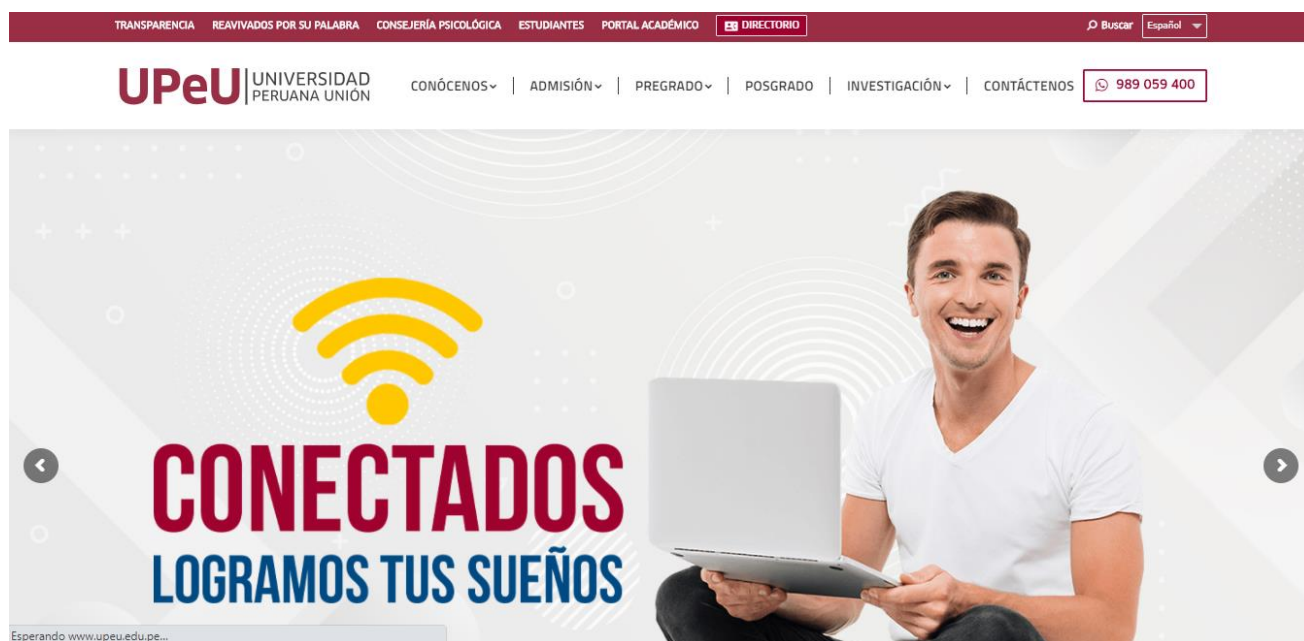
Figura 1 – Página web oficial de la Universidad Peruana Unión

Para ingresar al módulo de Portal del Alumno se tiene que escribir en el navegador http://www.upeu.edu.pe , luego ingresar a la opción Portal Académico que se encuentra en la parte superior (Ver Figura 1).