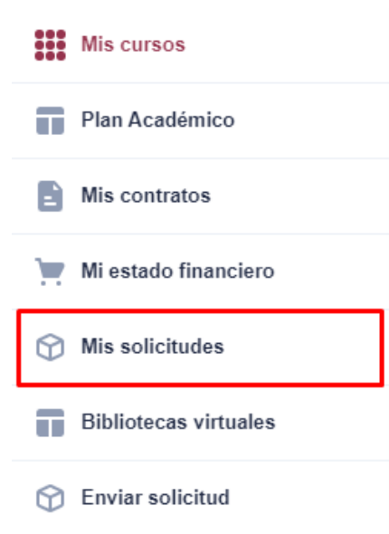
Figura 4– Accesos del módulo

Elegir la opción de Mis Solicitudes, el sistema mostrará un reporte para seleccionar los siguientes filtros: (1) Tipo de trámite: convalidación interna, (2) semestre. Ver Figura 5.