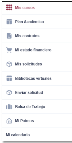
Figura 4– Accesos del módulo Portal del alumno

Elegir la opción de Enviar solicitud y el sistema mostrará la siguiente vista, donde mostrarán los datos del estudiante. Ver Figura 5.