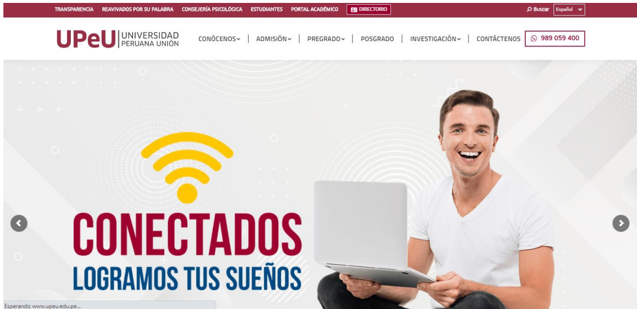
Figura 1 – Página web oficial de la Universidad Peruana Unión

Para ingresar al módulo de Portal del Alumno se tiene que escribir en el navegador http://www.upeu.edu.pe , luego ingresar a la opción Portal Académico que se encuentra en la parte superior (Ver Figura 1).