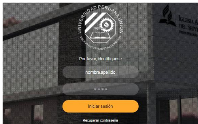
Figura 2 – Página web de ingreso al Portal Académico.

En el Portal Académico se deberá ingresar con el usuario y contraseña proporcionado por la Dirección General de Tecnologías de Información (DIGETI) de la UPeU (Ver Figura 2).